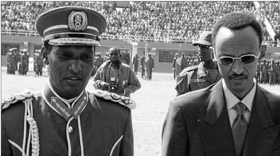
Kayumba Nyamwasa era el braç dret del president de Rwanda Paul Kagame. Ambdós a la fotografia

Nyamwasa era el braç dret del president de Rwanda, Paul Kagame. Jaume Asens explica que va fugir